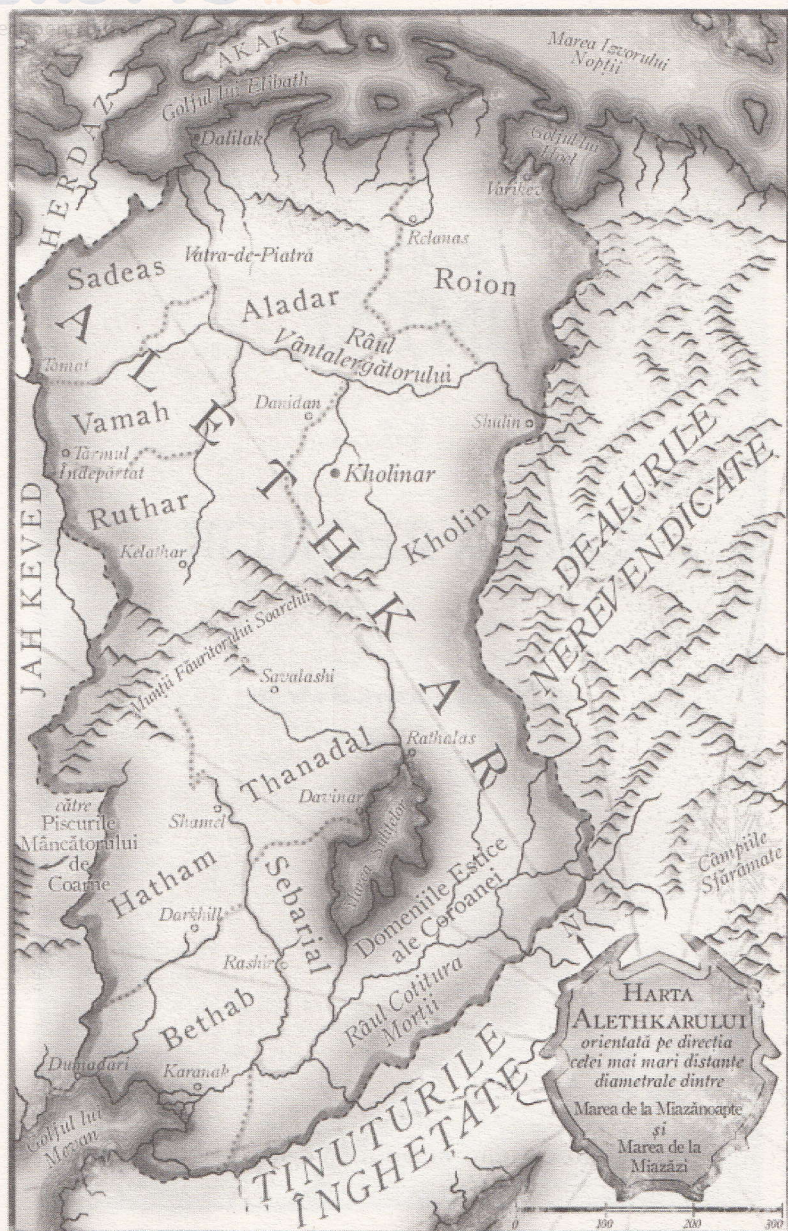
Harta Alethkarului și a împrejurimilor, întocmită de topograful de la curtea regală a Maiestății Sale Gavilar Kholin (circa 1167)